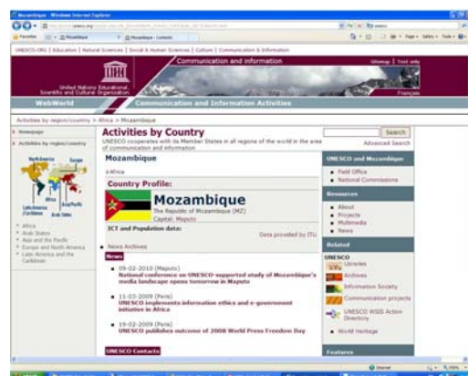
Página Web da UNESCO: www.unesco.org

Participaram do encontro organizações que tra-