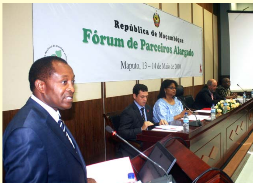
Presidente do CD do CNCS, Aires Aly, discursando na sessão de abertura do Fórum de Parceiros Alargado

Primeiro-Ministro e Presidente do CNCS, Aires Aly, sublinhou a necessidade de descentralização das acções de combate ao HIV e SIDA.