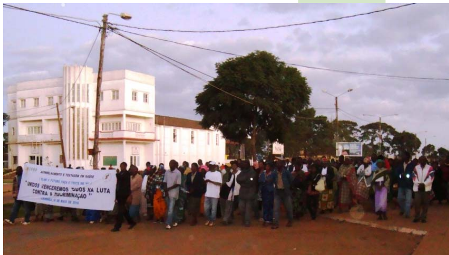
Marcha durante o memorial à Luz de velas pelas vítimas do SIDA em Lichinga

de velas na igreja Católica, seguido de uma marcha e um discurso proferido pelo Governador da Província.