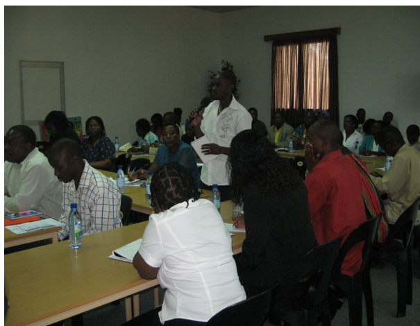
Direcção de Saúde e as Organizações de PVHS da Cidade de Maputo Boletim Informativo

Algumas organizações de Pessoas Vivendo com HIV/SIDA (PVHS) dos bairros de Bagamoio e de Chamanculo reclamam a falta de sigilo profissional, confidencialidade e actos de discriminação nas unidades sanitárias.